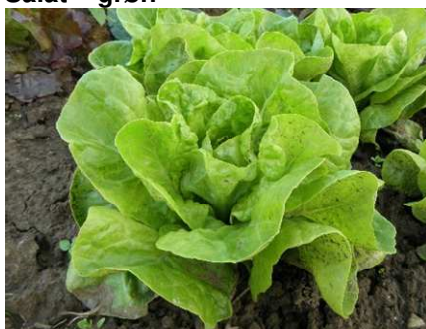
Salat – grøn