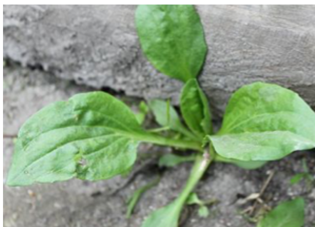
Bilag 22: Vejbred