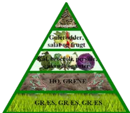
Bilag 6: Kaninens kostpyramide