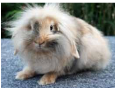
Løvehoved Dværg Vædder