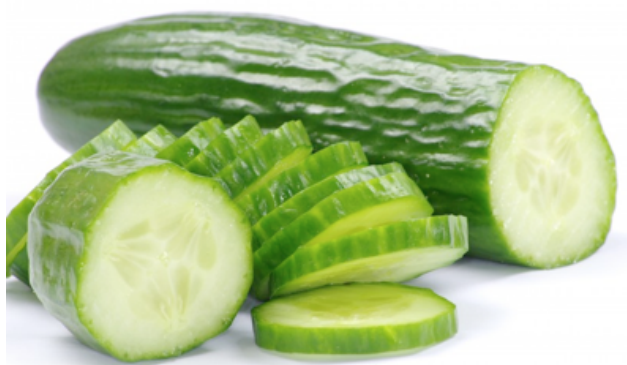
Bilag 18: Agurk

Bilag 7-19: Eksempler på grøntsager til kaniner