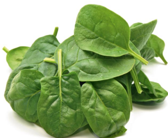
Bilag 14: Spinat