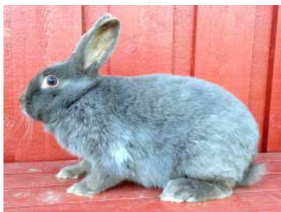
Stor Marburger Egern