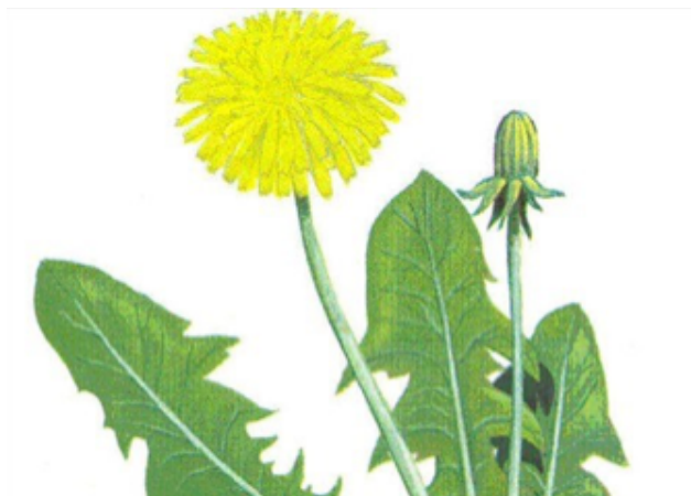
Bilag 20: Mælkebøtter

Bilag 20-22: Eksempler på vilde planter til kaniner