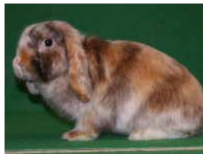
Dværg Vædder, satin