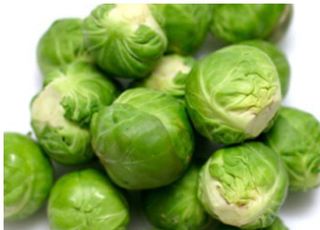
Bilag 9: Rosenkål