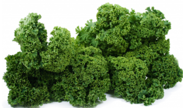
Bilag 10: Grønkål