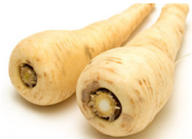
Bilag 16: Pastinak