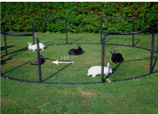
Bilag 33: Løbegård til kaniner