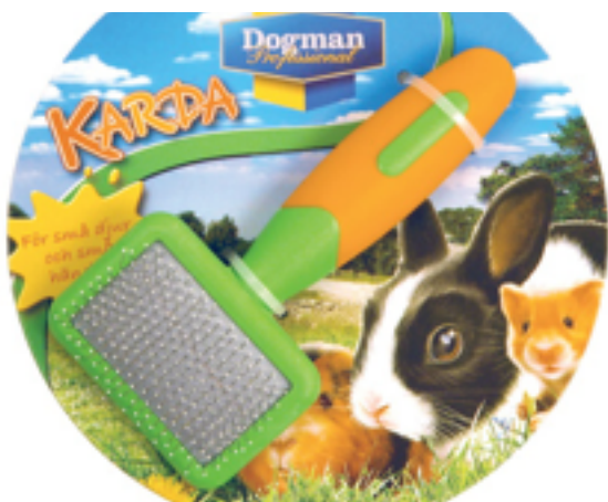
Bilag 5: Børste