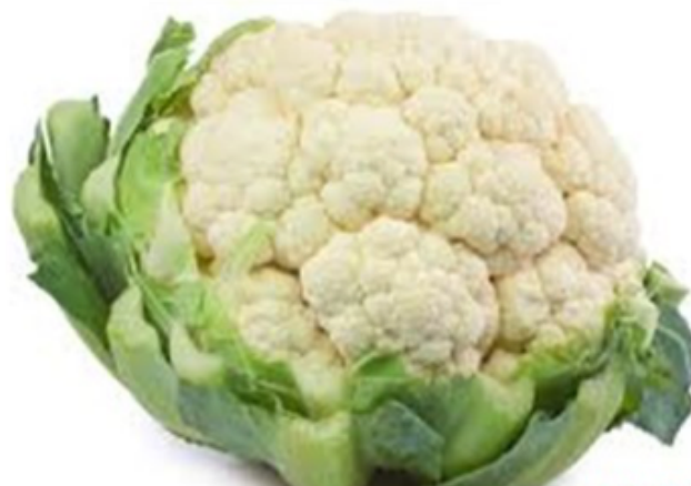
Bilag 13: Blomkål