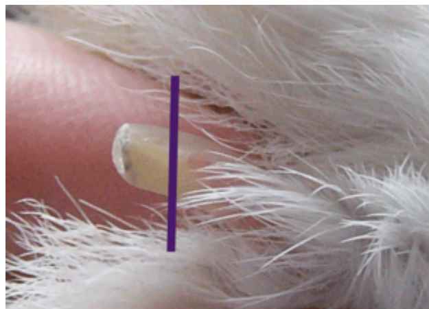
Bilag 2: Eksempel på, hvor neglen skal klippes