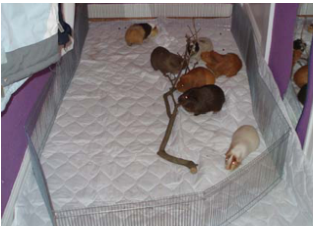
Bilag 38: Løbegård