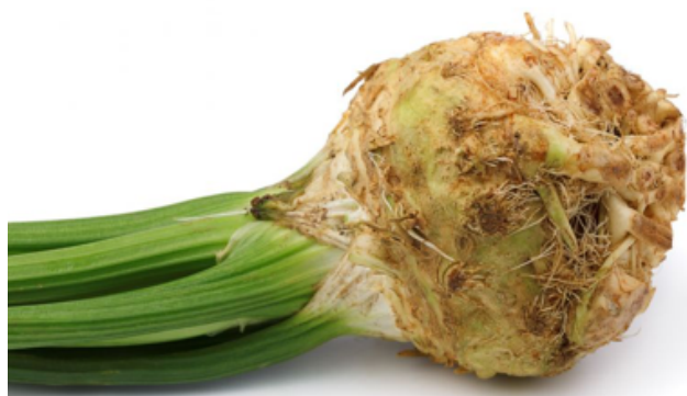
Bilag 11: Knoldselleri