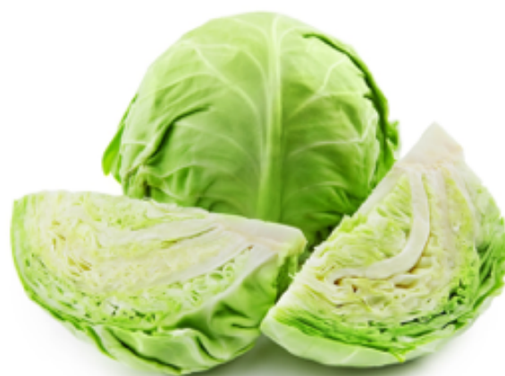
Bilag 17: Hvidkål