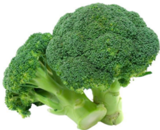
Bilag 8: Broccoli