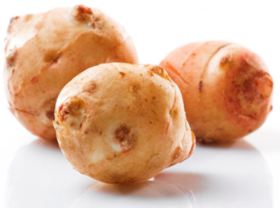
Bilag 19: Jordskokker

Bilag 20-22: Eksempler på vilde planter til kaniner