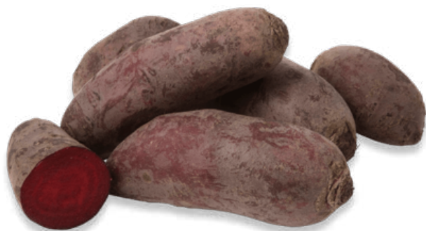
Bilag 7: Rødbeder