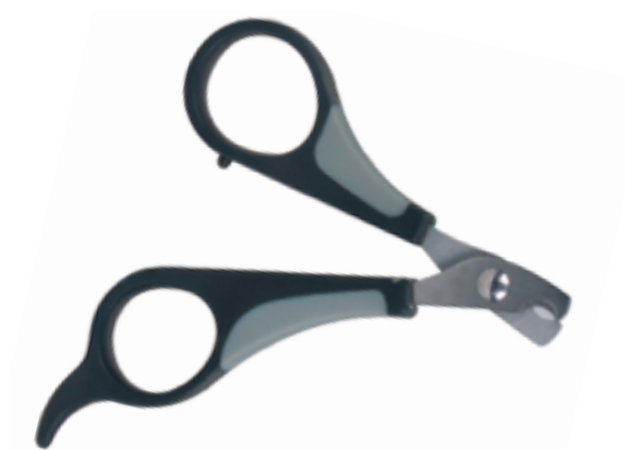
Bilag 4: Neglesaks