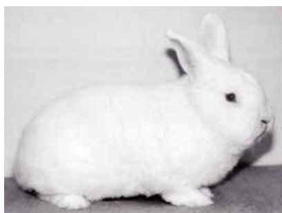
New Zealand White