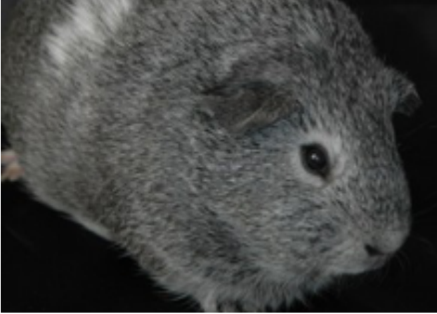
Bilag 34: Eksempel på den ruhårende race "Rex"