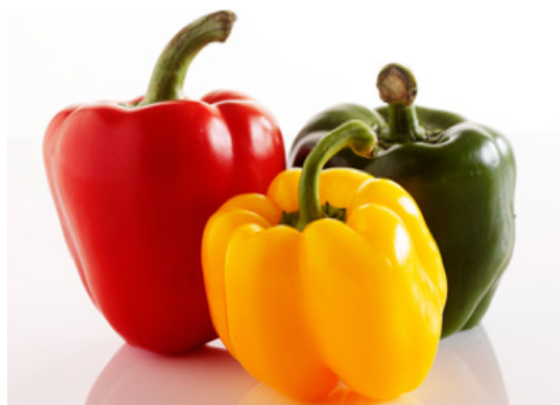
Bilag 15: Peberfrugt