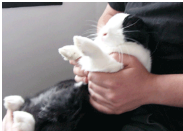
Bilag 1: Sådan kan du holde din kanin, når den skal have klippet negle