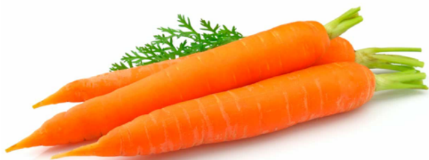
Bilag 12: Gulerødder

Bilag 7-19: Eksempler på grøntsager til kaniner