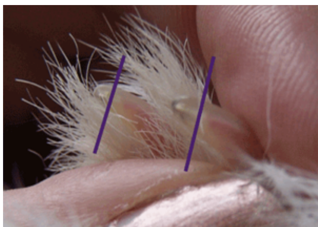
Bilag 3: Eksempel på, hvor neglene skal klippes