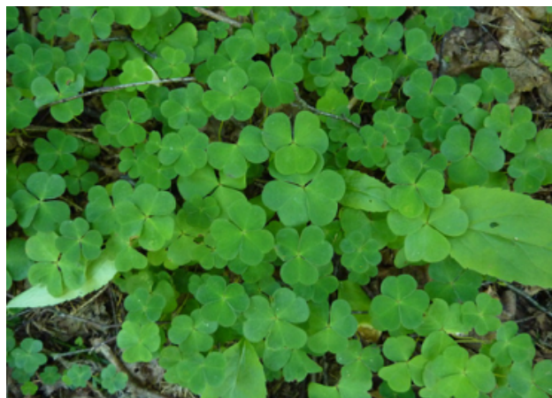
Bilag 21: Kløver