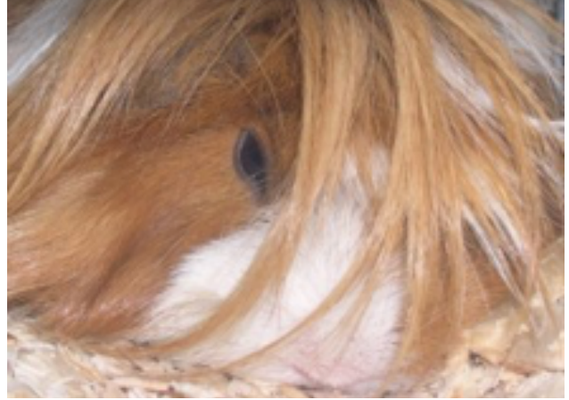
Bilag 35: Den langhårede race "Texel", der kræver særlig hårpleje