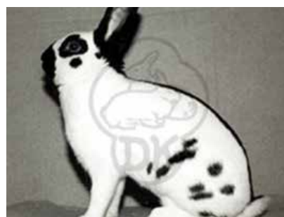
Lille Tysk Schecke