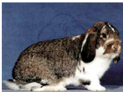
Lille Tysk Vædder