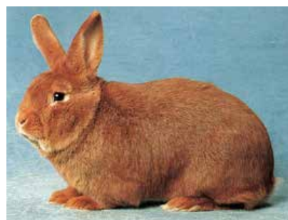
New Zealand Red